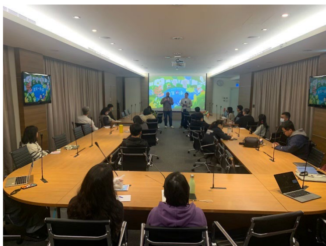
第 1 場次-聯合報系永續工作室